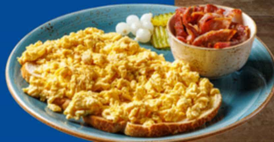
Bacon and eggs