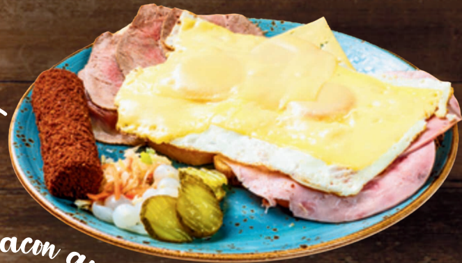
Bacon and eggs